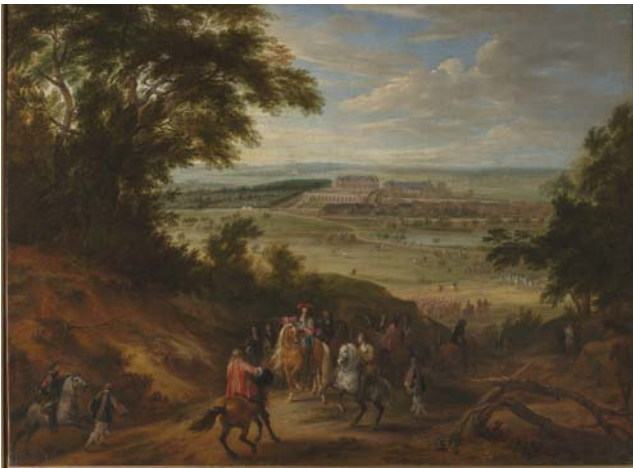
Vue du château de Versailles, du côté de l'Orangerie, prise depuis les hauteurs de Satory, 1664 Adam-Frans Van der Meulen Château de Versailles

LE CHÂTEAU DE VERSAILLES ET ORANGE LANCERONT CET AUTOMNE UN MOOC CULTUREL GRATUIT destiné au grand public. Il permettra au plus grand nombre de découvrir et d'approfondir ses connaissances sur la vie de Louis XIV à Versailles.