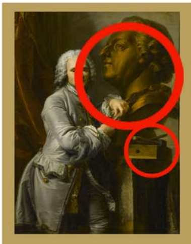
Jean Valade Jean-Baptiste II Lemoine (1704-1778), sculpteur, 1754 MV5978

Réalisé pour l'Académie royale de Peinture, le peintre Charles-Antoine Coypel s'est représenté au travail, le pinceau à la main, dans l'intimité de son atelier.