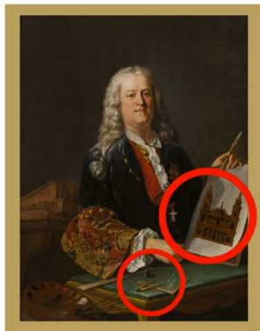
Jean-Nicolas Sarvandoni Autoportrait, après 1749 MV5826

Le sculpteur est représenté en train d'achever une statue de Louis XV avec ses outils : son maillet, sa gradine et ces ciseaux à sculpter.