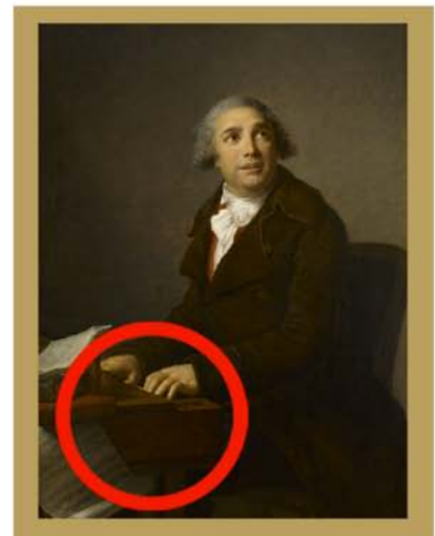
Elisabeth Vigée-Lebrun Giovanni Paisiello, 1791 MV5877

Sarvandoni, qui était architecte et décorateur, s'est représenté avec ses outils. Il tient dans ses mains son projet de rénovation pour la façade de l'église Saint-Sulpice à Paris.