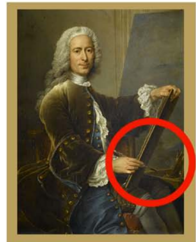
Charles-Antoine Coypel Autoportrait, 1746 MV5813

Couperin qui était organiste, est représenté devant son orgue, instrument dissimulé sous une épaisse tenture pourpre.