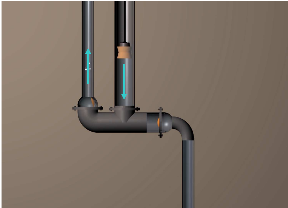
Illustration 3 : Le piston est poussé vers le bas. Cela crée une compression qui ouvre la soupape B et ferme la soupape A. L'eau est refoulée dans le tuyau montant. Capture d'écran de la vidéo « Fonctionnement d'une pompe aspirante et refoulante ».