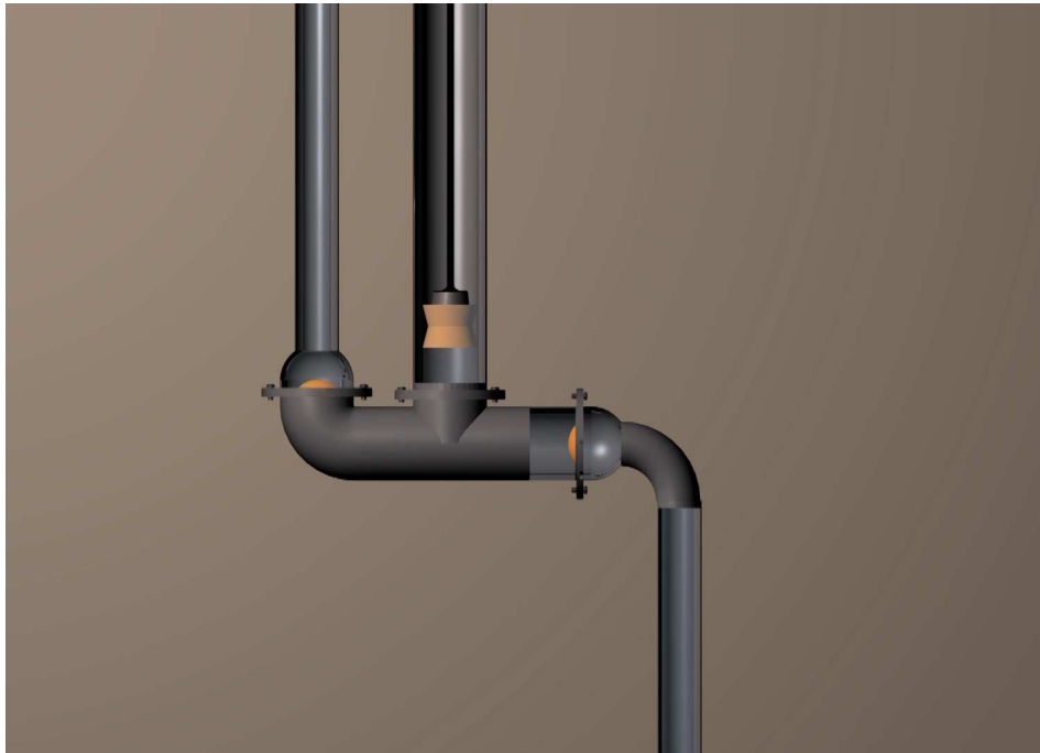
Illustration 4 : Le piston est à nouveau en position basse. Le cycle reprend avec l'illustration 2.

Capture d'écran de la vidéo « Fonctionnement d'une pompe aspirante et refoulante ».