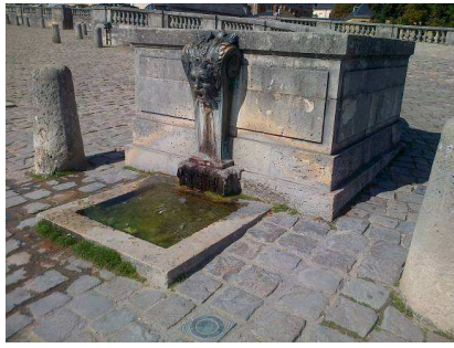
Fontaine de la rampe Nord à l'entrée du chateau

Mais, comme le souligne Mathieu Da Vinha, le réseau s'avère rapidement insuffisant pour pourvoir aux besoins du chateau et de la ville, Louis XIV charge Colbert de demander aux savants d'imaginer une machine pour amener l'eau de la Seine jusqu'à Versailles. Ce sera la célèbre machine de Marly mise en service en 1685.