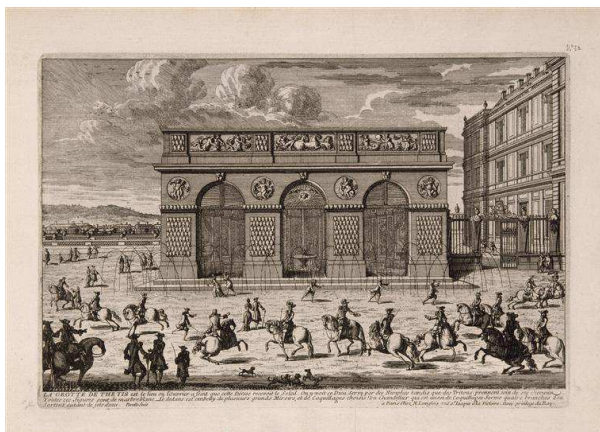
Famille des Perelle, Vue de la façade de la Grotte de Thétis au chateau de Versailles , XVII e siècle, estampe, Chateau de Versailles, © RMN-Grand Palais (Chateau de Versailles) / Gérard Blot.

Entre 1676 et 1688, Louis XIV, voulant sans doute améliorer l'alimentation de son chateau en eau courante et bonne à boire sollicita l'Académie des sciences pour développer le système hydraulique. Plusieurs fontaines d'eau courante apparaissent au chateau, dont les plus marquantes furent celles du Grand Escalier du roi (Escalier des Ambassadeurs) et de la grotte de Thétis. Le roi pouvait désormais boire de l'eau saine qui parvenait directement dans son chateau. Des réservoirs d'eau saine pour un usage autre que celui de la bouche (comme ceux de Montbauron alimentés par l'eau de la machine de Marly ou encore ceux, édifiés par Gobert, qui recevaient l'eau du plateau de Saclay) furent construits pour satisfaire à une demande de plus en plus importante.