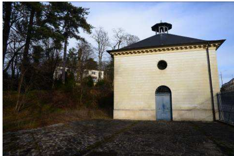
Vues du pavillon des filtres

En 1734, le duc d'Antin, directeur des Bâtiments du roi, édicte des règles d'hygiène et fait restaurer les fontaines. Il décide de distribuer à Versailles l'eau de Seine élevée par la machine de Marly et acheminée à Versailles via un aqueduc souterrain. Cette eau arrivait depuis 1685 jusqu'au regard de Picardie et de là rejoignait les réservoirs de Montbauron par l'aqueduc appelé le Mur de Montreuil, remplacé en 1736 par des siphons en fonte. Afin d'éviter toute pénurie il décide de créer une réserve d'eau sur la butte de Picardie. Réalisée en 1763-1764 par le contrôleur général Hubert Pluyette sous la direction d'Ange-Jacques Gabriel, premier architecte du roi, cette réserve prend le nom de Bassin de Picardie. Mais l'eau de la Seine est polluée et devient de moins en moins bonne à boire. Louis XVI fait alors édifier le pavillon des Filtres qui offre un système de filtrage de l'eau formé de plusieurs bacs remplis de graviers. Restauré en 1996, le pavillon des Filtres est classé monument historique.