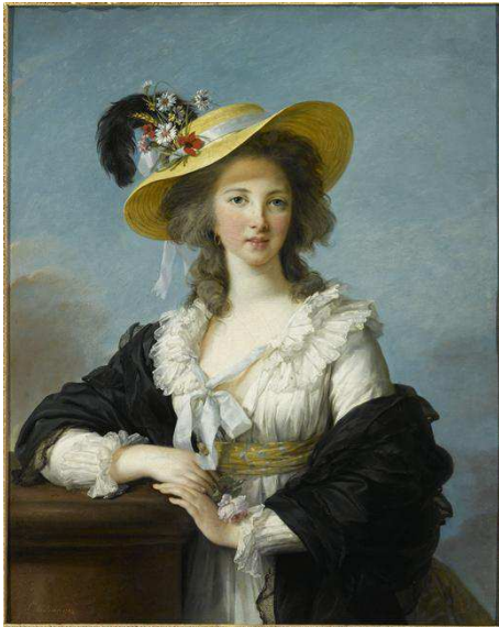
Elisabeth Louise VIGEE-LE-BRUN, Portrait de la duchesse de Polignac, dit Portrait au chapeau de paille , 1782, Château de Versailles, © RMN-Grand Palais (Château de Versailles) / Gérard Blot

du médecin bien plus qu'au manuel de civilité. Naturel bourgeois contre artifice » aristocratique ? Une telle opposition, si elle reste simplificatrice, a pourtant bien une résonance sociale à la veille de la Révolution française.