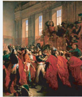
Coup d'État du 18 Brumaire an VIII 9 novembre 1799