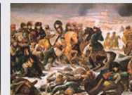
9 février 1807 Bataille d'Eylau