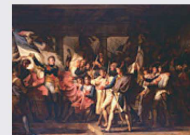
7 novembre 1805 Bataille d'Innsbruck