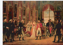
18 mai 1804 Bonaparte proclamé empereur