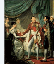
20 mars 1811 Naissance du roi de Rome

2 mars 1796 Bonaparte général en chef de l'armée d'Italie