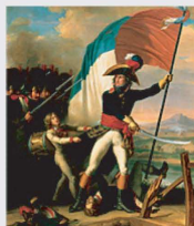
15 novembre 1796 Bataille d'Arcore