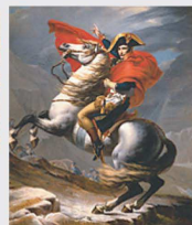
20 mai 1800 Passage du Grand Saint-Bernard