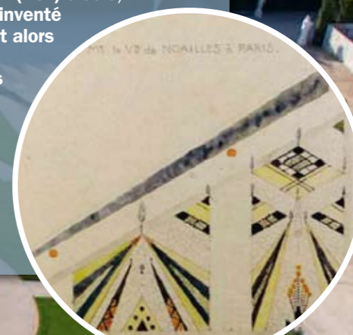
Peinture datant de 1924, illustrant un projet de jardin pour l'hôtel du vicomte de Noailles, à Paris.

Malgré un long règne du jardin « à l'anglaise », les créations de Le Nôtre ont continué d'être un modèle. À la fin du XIX e (19 e ) siècle, ce modèle a même été réinventé et réinterprété. On pouvait alors observer dans les œuvres de beaucoup de créateurs de jardins de jardins un retour à la rigueur géométrique, à des végétaux taillés... À cette époque, la France revendiquait une suprématie totale en matière de culture et donc d'art des jardins.