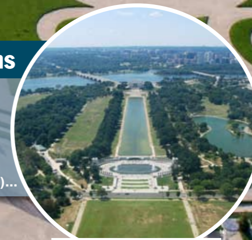
Vue aérienne de Washington (États-Unis).