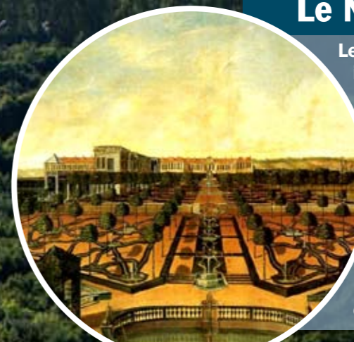
Peinture datant du XVIII e (18 e ) siècle, représentant le jardin de La Malgrange, à Nancy (54).

Le Nôtre est mort en 1700, mais il est resté un modèle. Son style n'a pas disparu avec lui. À partir des années 1760-1770, la mode des jardins « à l'anglaise » a commencé à se développer en France, mais, jusqu'à la Révolution (1789), le style « à la française » de Le Nôtre a continué à s'imposer dans les grandes résidences royales, les nouvelles promenades publiques et beaucoup de parcs privés.