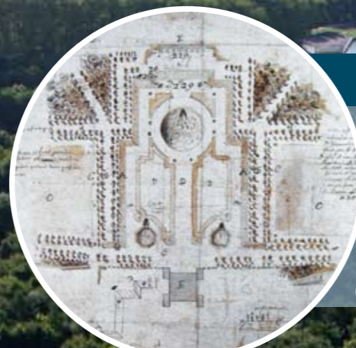
Plan de la maison de Greenwich (Angleterre), avec son jardin, datant du XVII e (17 e ) siècle.

Roi des jardiniers et jardinier du roi Louis XIV (14), Le Nôtre est le créateur des plus beaux jardins du XVII e (17 e ) siècle et a fait de Versailles son chef-d'œuvre absolu. Les invités du Roi-Soleil étaient éblouis à chacune de leurs promenades. Ses talents lui ont valu une fortune très importante et une renommée internationale, toujours d'actualité.