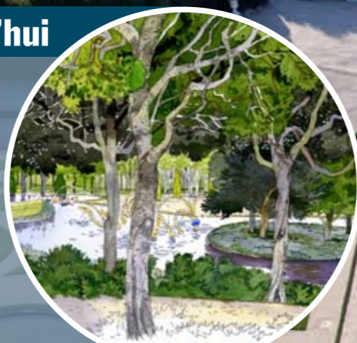
Croquis du bosquet du Théâtre d'Eau, imaginé par Louis Benech et Jean-Michel Othoniel.

En 1906, le parc et le château de Versailles ont été inscrits au Patrimoine mondial et classés aux Monuments historiques. Aujourd'hui encore, on les admire. Le tracé général du parc est resté le même depuis Louis XIV (14), mais les tempêtes de 1990 puis de 1999 ont rendu nécessaires certaines restaurations. Le bosquet du Théâtre d'Eau, par exemple, est actuellement en travaux. Jean-Michel Othoniel, artiste, et Louis Benech, paysagiste, sont chargés de réinterpréter ce bosquet. Louis Benech explique : « J'ai gardé les règles de composition de Le Nôtre, mais j'ai apporté de la modernité. Par exemple, j'ai associé des végétaux qui n'avaient jamais été plantés ensemble : certains sont chinois, d'autres français... »